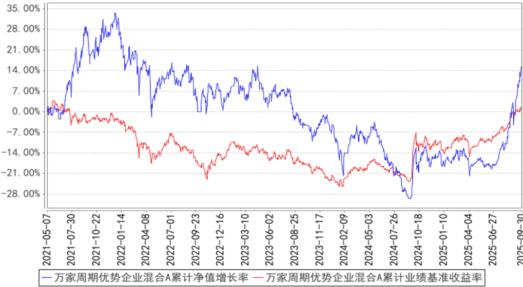
万家周期优势企业混合A累计净值增长率与同期业绩比较基准收益率的历史走势对比图