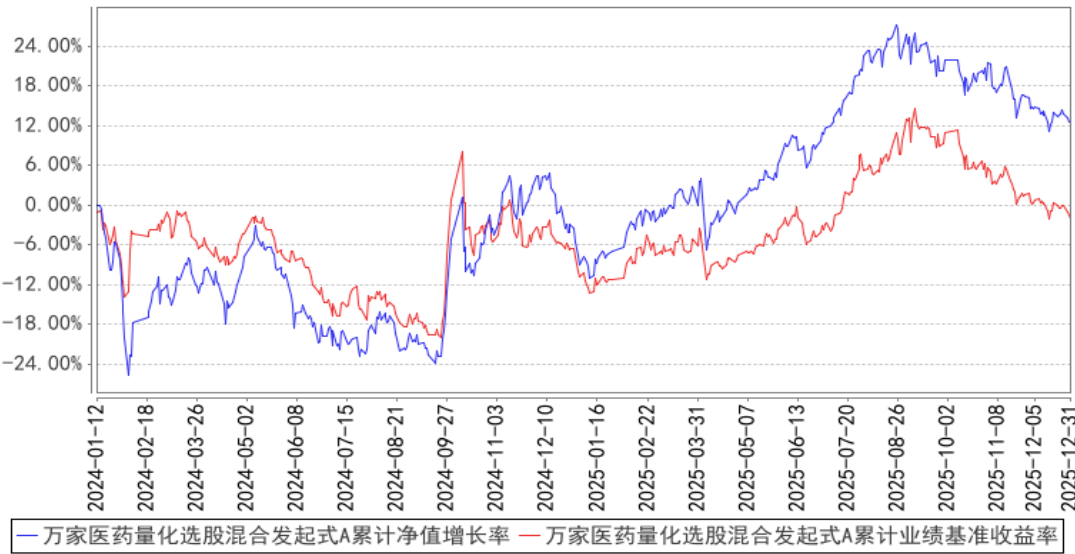
万家医药量化选股混合发起式A累计净值增长率与同期业绩比较基准收益率的历史走势对比图